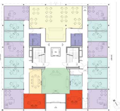
Plan de rez-de-chaussée

L'entrée principale du bâtiment est marquée par un grand percement tridimensionnel dans le volume principal. Une marquise en verre et métal, suspendue à la façade par des tirants en inox accentue la force de cette entrée. Un jeu de spots sur et sous les sommiers du rez-de-chaussée contribue à l'animation et à la mise en valeur de la façade en marquant, de nuit, les volumes et les profondeurs subtiles du bâtiment.